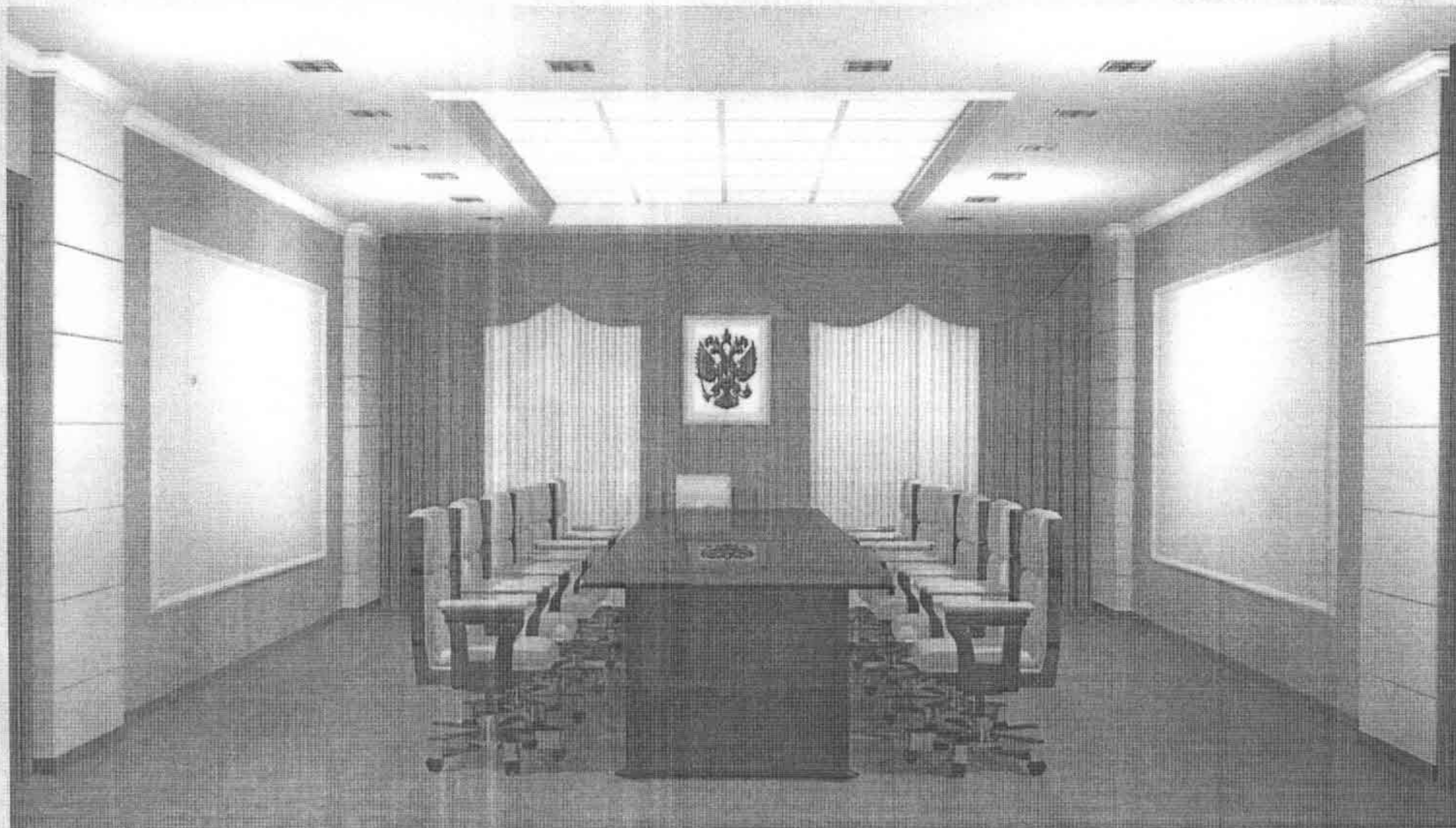
Проект зала заседаний Президиума Семнадцатого арбитражного апелляционного суда

СЕМНАДЦАТЫЙ АРБИТРАЖНЫЙ АПЕЛЛЯЦИОННЫЙ СУД: НАЧАЛО